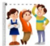
키 성장 방해