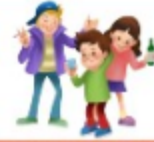
청소년 범죄 위험성 증가