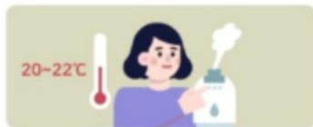
실내 온도와 습도 적절히 유지 온도: 20~22℃, 습도: 50~60%