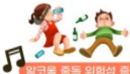
알코올 중독 위험성 증가