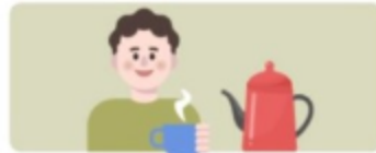
따뜻한 물 충분히 마시기