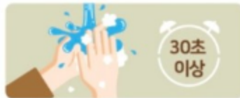
외출 후 비누를 사용하여 흐르는 물에 30초 이상 손 씻기